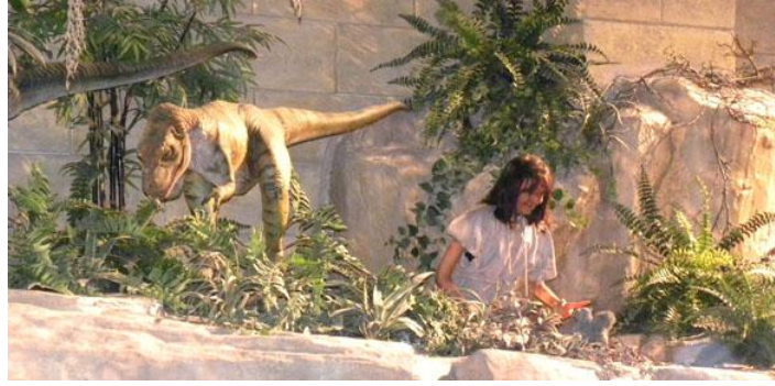
حواء مع الديناصورات، متحف الخليقة

يمكن العثور على إجابة واحدة لهذا السؤال الأخير في متحف الخليقة Creation Museum الذي أُفتُح في عام ٢٠٠٧ في مدينة بيتزبرج Petersburg، بولاية كنتاكي Kentucky على بعد حوالي أربعة أميال غرب مدينة سينسيناتي Cincinnati. وهو مرفق قيمته ٢٧ مليون دولار يديره كن هام Ken Ham الأسترالي المؤلد ويهدف المتحف إلى تقديم خلق الأرض كتفسير حرفي لسفر التكوين. ففي تفسير عملية الخلق المعروفة باسم "الأرض الصغيرة السن" - "young Earth"، خُلِقَ العالم منذ ٦٠٠٠ سنة فقط، وآدم وحواء شخصيات تاريخية، وجميع الحيوانات التي عاشت على هذا الكوكب خُلِقَتْ في نفس هذه الفترة القصيرة، أي الأيام السبعة. ومن ثم، يتضمن المتحف معرضًا للكائنات البشرية التي عاشت في نفس الوقت الذي عاشت فيه الديناصورات.