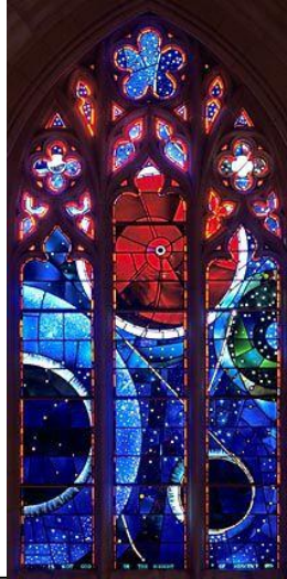
"نافذة الفضاء" في الكاتدرائية الوطنية في واشنطن. تحتوي الدائرة البيضاء الصغيرة في المركز على جزء من صخرة القمر التي أحضرها نيل أرمسترونج وبيز ألدرين في أول هبوط لهما على سطح القمر.

يوافق هذا العام الذكرى السنوية الخمسين لهبوط رائدي الفضاء، نيل أرمسترونج Neil Armstrong وبيز ألدرين Buzz Aldrin، على سطح القمر في المهمة أبولو ١١ التي تَمَّتْ في ٢٠ يوليو/تموز ١٩٦٩. بعد ست ساعات من هبوط المركبة القمرية إيغل Eagle، في ٢١ يوليو/تموز، أصبح أرمسترونج أول إنسان يمشي على سطح القمر. كانت كلمات أرمسترونج عند أول خطوة على سطح القمر مفعمة بزهو النصر، ومع ذلك لم يكن فيها ما يسيء: "خطوة صغيرة لإنسان، ولكنها قفزة كبيرة للبشرية". ولحسن الحظ، لم يكن هناك نبرة قومية في كلماته. فبالنسبة له، كان الهبوط على سطح القمر انتصارًا للبشرية جمعاء. لكن من المؤكد أن أنشودة انتصاره تنقصها النغمة الروحية. ألم يكن وصول البشرية الأول على جرم سماوي بمثابة وقفة للبشر ليأخذوا بعين الاعتبار مكانهم في المخطط الكبير للكون؟ في الواقع، هذا ما حدث.