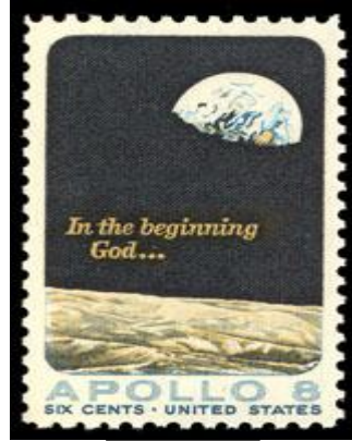
طابع تذكاري للمهمة

تلك الرحلة حول القمر، وصورة الأرض، وكلمات سفر التكوين كانت مفاجأة للعديد من الناس في ذلك الوقت. وبطريقة ما تراءى الكوكب للبشر أكثر هشاشة ولكنه أكثر قيمةً وتميزًا من أي وقت مضى. والرسالة الدينية التي ابتدأت بقراءة الآيات الافتتاحية من سفر التكوين نَهَتْ الجميع إلى أن الأرض لم تكن صدفة. لم تكن مصادفة حَرَجَتْ من فوضى الكون. ولكنها كانت نتاج عناية الله المحب، الله الذي خلق منزلاً جميلاً لأولاده.