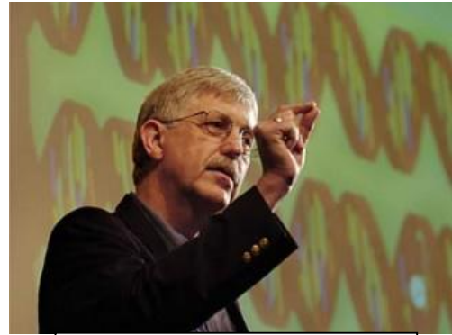
فرانسيس كولينز، الطبيب وعالم الوراثة الذي ترأس مشروع الجينوم البشري.

فقد اكتشف العلماء، أثناء العمل في مشروع الجينوم البشري، أن الأبجدية التي تُكوّن نص الحمض النووي DNA تتألف من أربعة حروف فقط ولكن كل جين يتكون من مئات أو آلاف من الحروف الشفوية. في الواقع، الحمض النووي عند البشر يتكون من ٣,١ مليار حرف. وكتب كولينز أنك إذا طبعت "هذه الحروف في حجم الخط العادي على ورقة الكتب العادية وربطتها جميعًا معًا ... [ستكون النتيجة] برج بارتفاع نُصّب واشنطن Washington Monument". ٢ والشيء المدهش هو أن كل هذه المعلومات معبأة في كل خلية من الخلايا الصغيرة التي تُشكل أجسامنا. ويكتب كولينز عن جمال وبلاغة هذا النظام من الترميز الجيني. وهو أيضًا متعدد الاستخدامات بشكل مدهش لأن نوع التشفير نفسه الذي يُنتج إنسانًا يُنتج أيضًا بكتيريا التربة، وعشبة الخردل، والتماسيح. نحن البشر قد نبدو مختلفين عن بعضنا البعض بسبب العرق والخلفية، لكننا جميعًا متماثلون بنسبة ٩٩,٩% على المستوى الجيني، مما يُرَجِّح بالطبع أننا جميعًا نشترك في نفس المنشأ، وأنا جميعًا خرجنا من نفس العائلة البشرية الصغيرة، ربما حتى من نفس الأم.